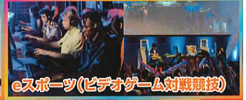
eスポーツ(ビデオゲーム対戦競技)