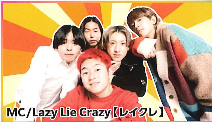
MC/Lazy Lie Crazy【レイクレ】