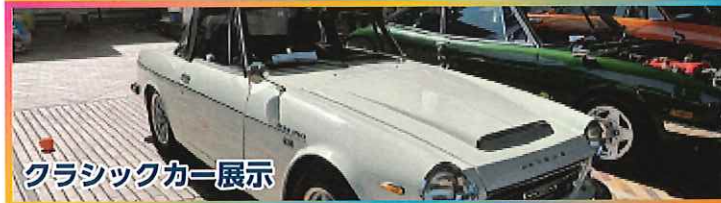
クラシックカー展示